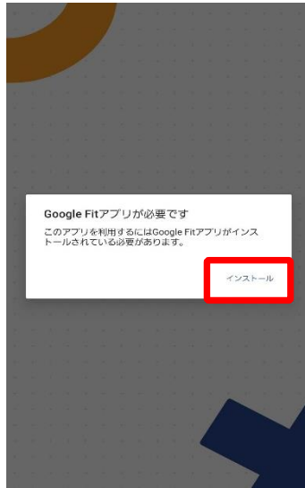
※Google Fitがインストールされていない場合は、上記画面が表示されます。インストール及び連携設定してください（P9、10参照）。