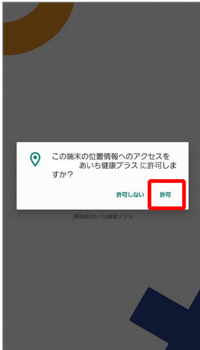
①位置情報へのアクセスに関して『許可』を押します。