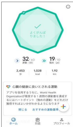
⑦ホーム画面に遷移して、Google Fitの登録が完了です。