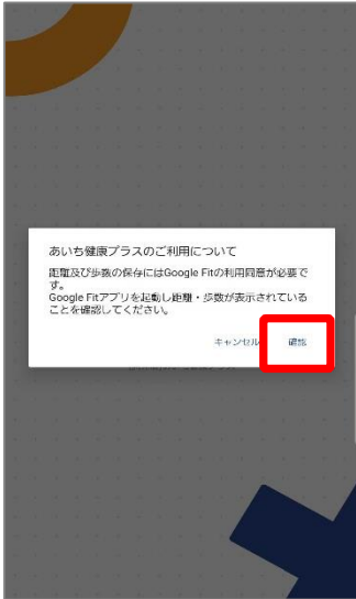
①あいち健康プラスを開くと、Google Fitとの連携確認画面が表示されますので、「確認」を押します。