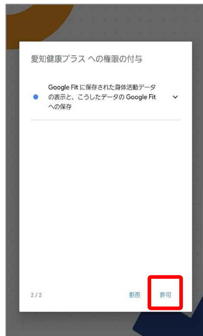
④あいち権限の付与 (2/2)に関して『許可』を押します。