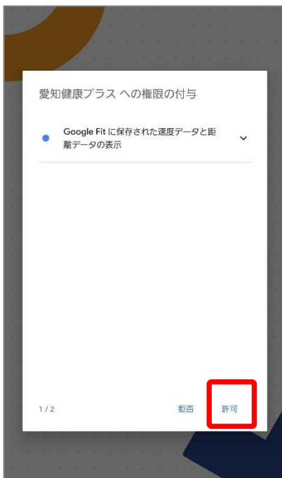
③あいち権限の付与 (1/2)に関して『許可』を押します。