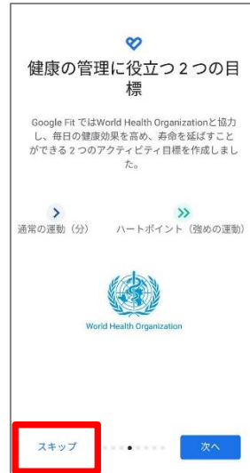
⑥健康の管理に役立つ2つの目標の登録へ進みます。『スキップ』を押します。