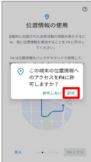
⑤位置情報のアクセス許可のダイアログが表示されたら『許可』を押します。