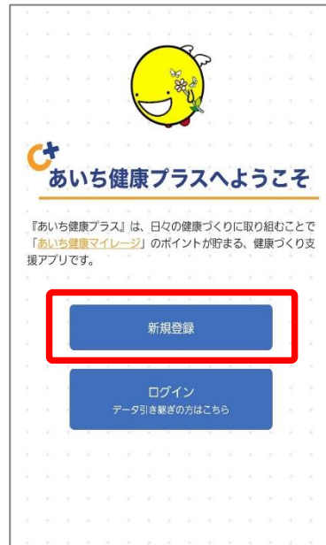
③あいち健康プラスを再度開いていただき、初期画面が表示されたら『新規登録』を選択します。