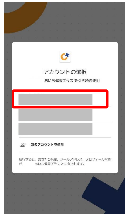
②Google fitで連携しているGoogle アカウントと同じものを選択します。