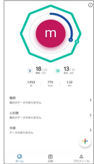
②Google Fitが起動され、ホーム画面が表示されます。表示後閉じてください。